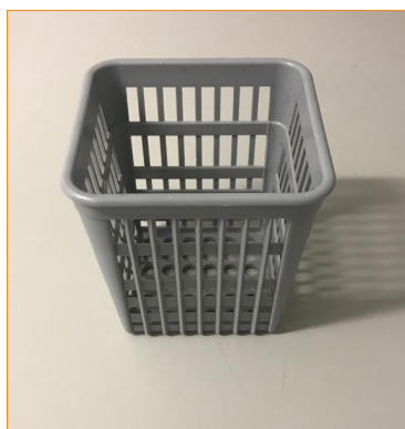
Вставка для столовых приборов 901621