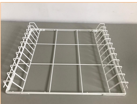
Кассета для подносов 901365 (570x620 мм)