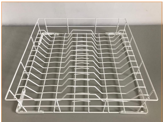
Кассета на 24 тарелки 901364 (570x620 мм)

1 кассета на 24 тарелки, 1 универсальная кассета, 1 кассета для подносов, 1 вставка для столовых приборов.