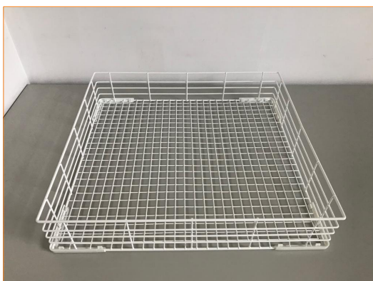
Универсальная кассета 901366 (570x620 мм)