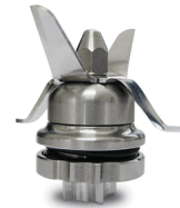
Removable assembly - Saturno X