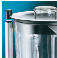
Microswitch on cover