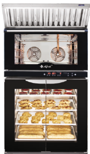
КЭП-4П на ШРТ-8