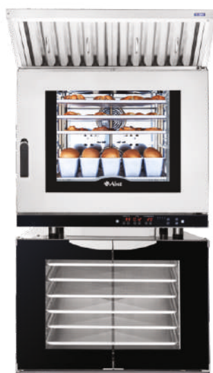
КЭП-6П на ШРТ-12