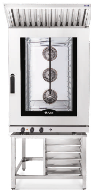
КЭП-10 на ПК-10-6/4